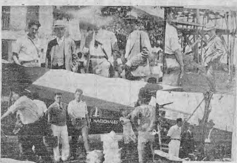
En la foto recogemos varias gráficas del puerto de Puntarenas, tomadas un día de gran movimiento: el domingo pasado...