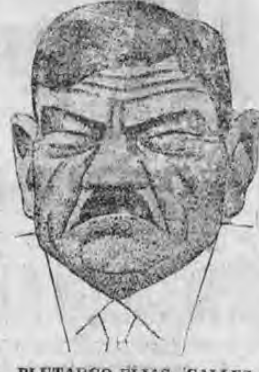
PLUTARCO ELÍAS CALLES